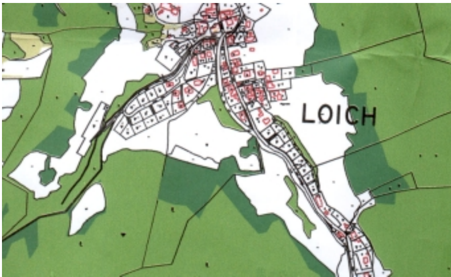
Waldzuwachs Loich: + 8,2 % in 30 Jahren