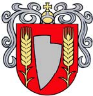
Gemeinde Šala (SK)