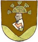
Gemeinde Thalgau (A)