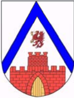
Gemeinde Eggesin (D)