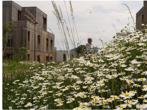
Wohnprojekt B.R.O.T. Pressbaum Generationsübergreifendes, nachhaltiges Wohnen