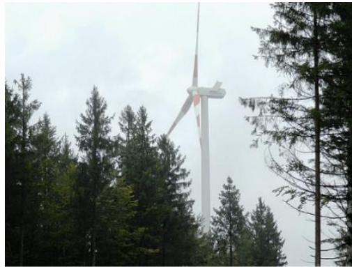
Windpark in Munderfing Strom für 10.000 Haushalte