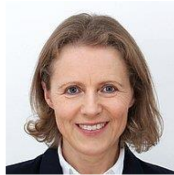
DI Natalie Glas Verwaltung/Politik