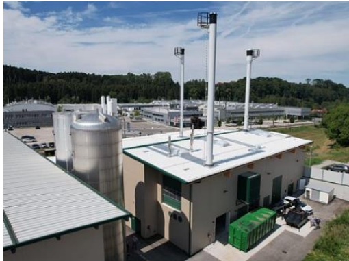
Nahwärme Biomassekraftwerk Vorchdorf Strom und Wärme aus Holz für rund 900 Haushalte in Vorchdorf