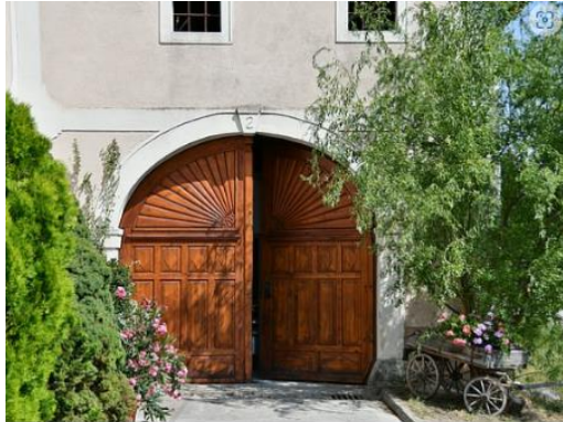
Schullers Hof-Greisslerei & Bio-Landwirtschaft Regionale Bio-Produkte ab Hof