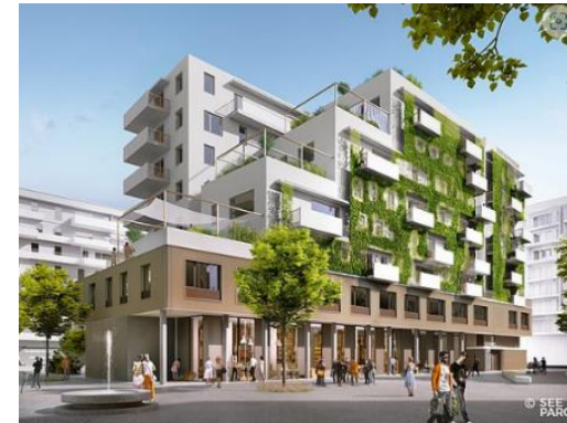
SEEPARQ Aspern Nachhaltiges, urbanes Wohnen in Wien