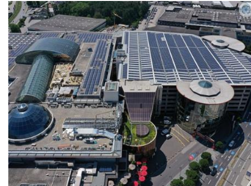
Solkraftwerk auf PlusCity PV-Anlage für Oberösterreichs größtes Shoppingcenter